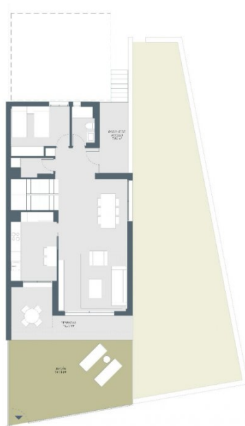
JARDÍN Y COCINA CERRADA